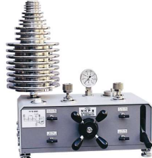
MHP 型・MHP-2 型