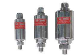
禁油圧力計用水槽接手