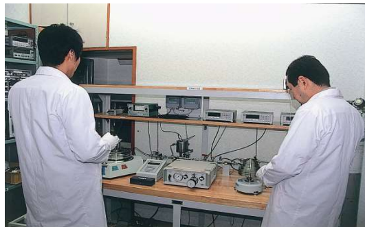
技術的教育・訓練

技術面での品質保証では、技術管理者により定期的に校正技術者に対して社内教育・訓練を実施し、校正の品質を確保しています。