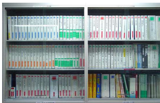
マネジメントシステム書庫

ISO/IEC17025に基づくマネジメントシステムを構築し、品質記録や技術記録を維持・管理しています。