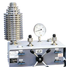
THP 型・THP-2 型